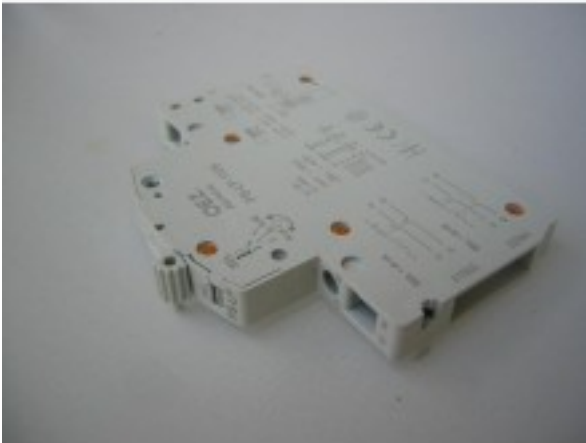
OEZ Hilfschalter 1xEin/2xAus PS-LP-110S-Y!